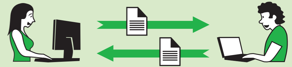
FORMATS OUVERTS, LOGICIELS DIFFÉRENTS

Pour que vos documents puissent être lus facilement par d'autres personnes, sans avoir besoin de vous soucier du logiciel qu'elles utilisent, choisissez des formats ouverts.