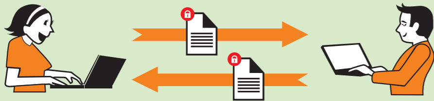
FORMAT FERMÉ, LOGICIELS IDENTIQUES

Des utilisateurs s'échangent un rapport.